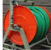
誰でも簡単に散水できます

業界最大級の巻取り幅500ミリの超ワイド巻取ドラムの採用で最長60m(※口径25mmの場合)のグリーンホースを巻いたまま散水ができます。