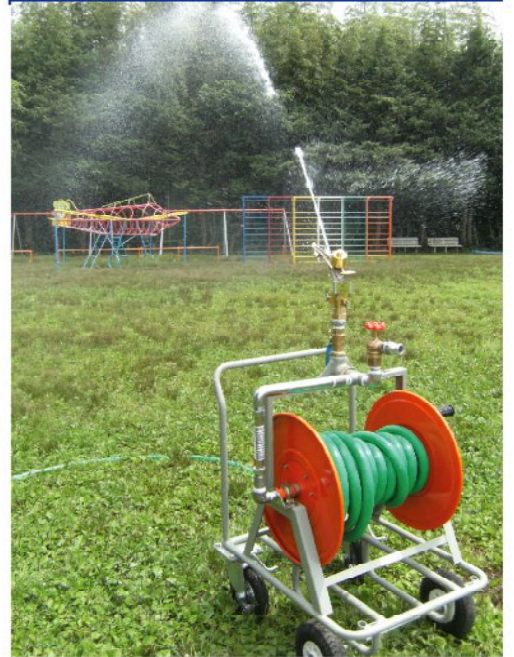
※幅609mm×奥行き765mm×高さ930mm(台車部分の寸法です) ※水圧は0.15~0.5Mps以内でご使用ください。