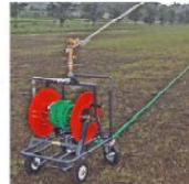
散水ノズルでも散水できます

グリーンホースを散水栓に連結して水を出すだけなので、難しい操作は必要ありません。使用者が変わるような現場や学校などの公共施設でも安心して使用できます。