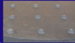
品名：ゴムカバー付マンホール