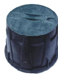
バルブボックス丸型