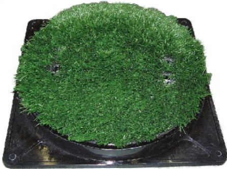
品名：人工芝付マンホール