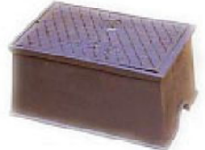
(鑄鉄製) 散水栓ボックス