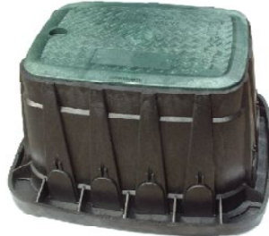
バルブボックス角型