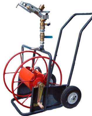
ライトレイン中型二輪散水車 NSG30-2WM型・SG25-2WM型 ※写真はNSG30-2WM