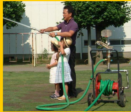
散水ノズル(ハンドスプレー)とスプレーガン(スプリンクラー)の2方式散水が可能、 NSG30-2WL-V型 もあります!