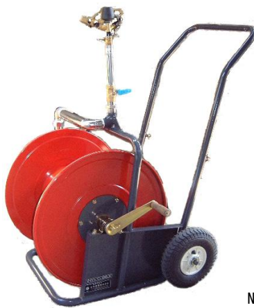
ライトレイン大型二輪散水車 ZB-2WL