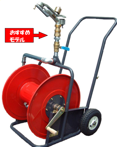
ライトレイン大型二輪散水車 NSG30-2WL型・SG25-2WL型 ※写真はNSG30-2WL