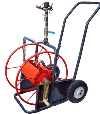
ライトレイン中型二輪散水車 ZB-2WM

永年使用していただくために必要です! 保守管理用品(シートカバー・グリスガン・高圧空気入れ)